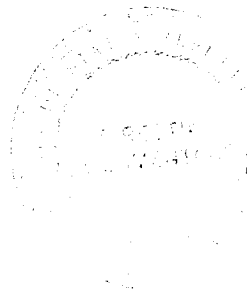
Victor Bodiu, Secretar General al Guvernului