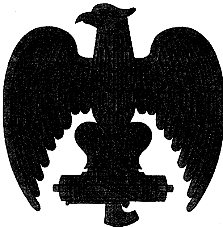
Vultur ținând în gheare fascii, simbolul l fascismul italian, folosit pe uniforme și chipiuri.