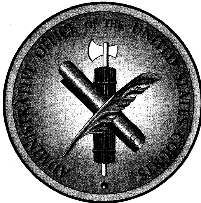
Stema Biroului Administrativ al instanțelor judecătorești din Statele Unite ale Americii