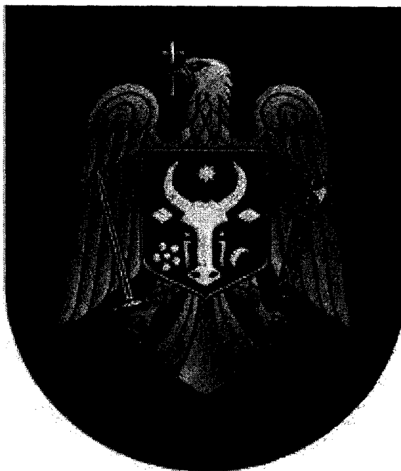
Emblema Ministerul Afacerilor Interne a R. Moldova