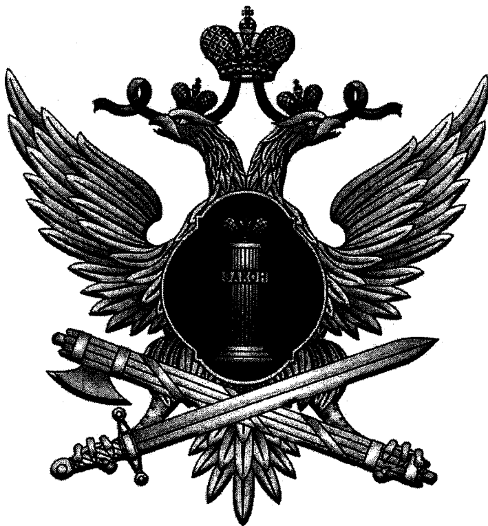
Федеральная служба исполнения наказаний России