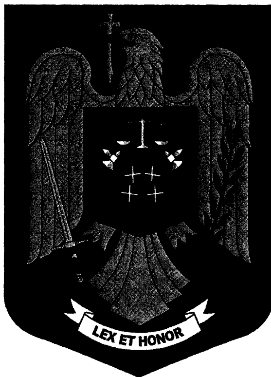
Emblema Inspectoratul General al Poliției Române